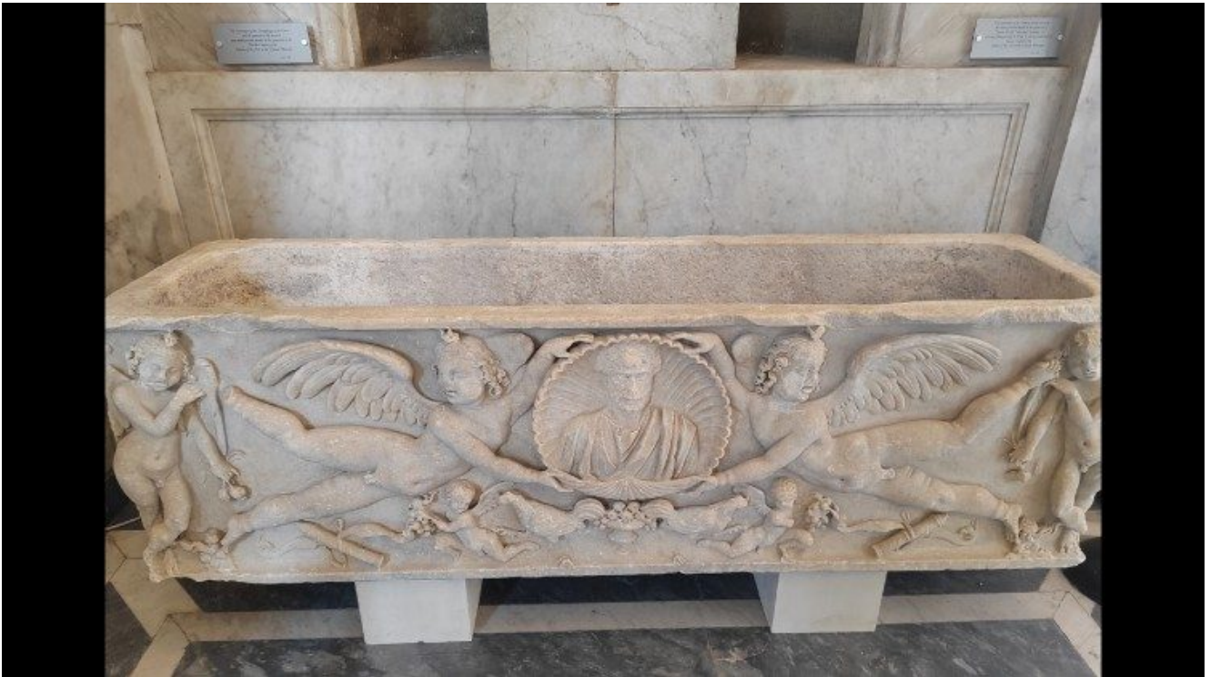
Sarcofago con eroti clipeofori