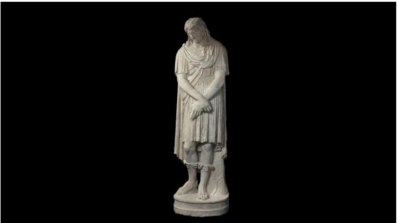
Statua di Barbaro (vestibolo Scala Simonetti,) – Musei Vaticani

Le nicchie ricavate nelle pareti di quello che all'epoca doveva presentarsi come un portico aperto sull'esterno, ospitano ancora oggi otto sculture, mentre altre quattro, insieme ai due sarcofagi decorati a rilievo, sono allestite nel vestibolo alla base della celebre Scala ideata da Michelangelo Simonetti. Sono tutte riferibili all'età romana e databili tra il I e il II secolo d.C. Tra le statue prevalgono soggetti maschili, come atleti ed eroi, ma anche figure di togati riferibili a contesti funerari, la cui provenienza non è possibile ricostruire. Attestato è invece il passaggio collezionistico della statua di Barbaro, presente a Villa Strozzi nel XVII secolo.